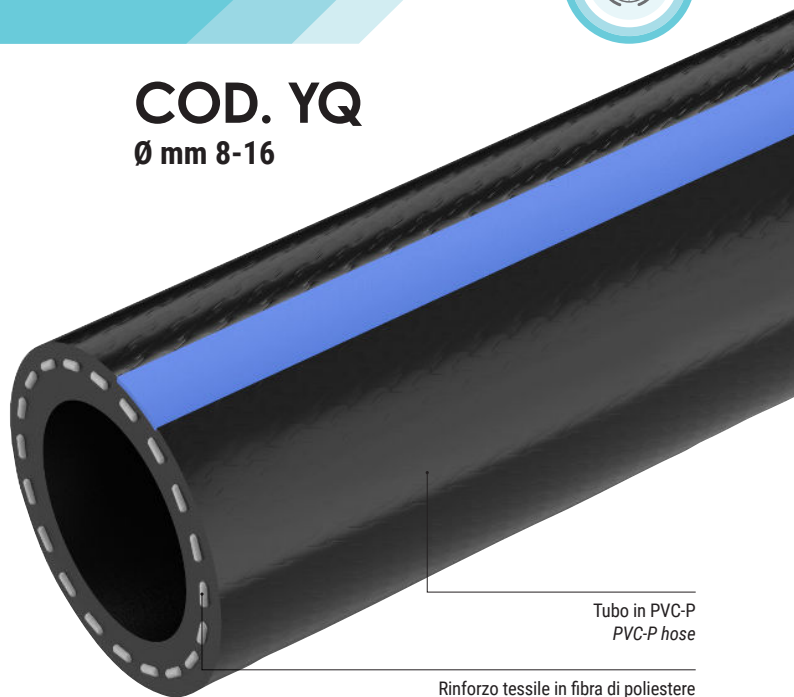
Tubo in PVC-P PVC-P hose